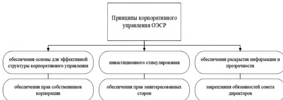
Рис. 1. Принципы корпоративного управления ОЭСР