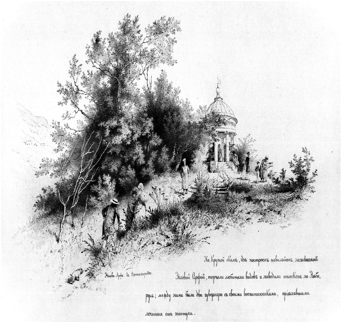
Эолова Арфа, гравюра М. А. Зичи.