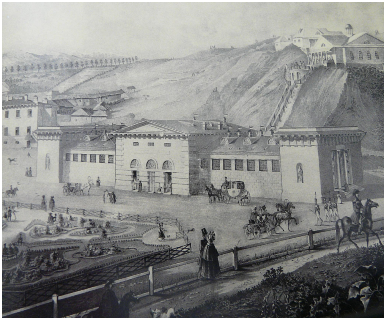
Николаевские (Лермонтовские) ванны, рисунок Иосифа (Джузеппе) Карловича Бернардацци.