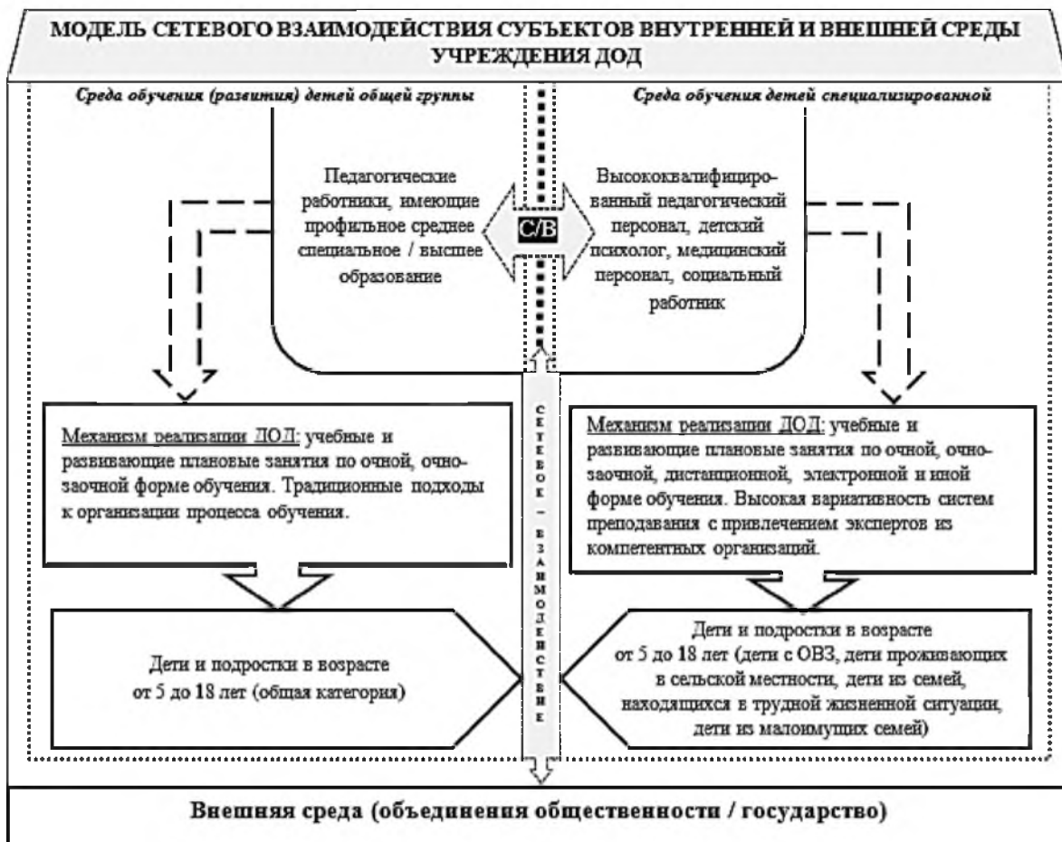
Рис. 3. Модель сетевого взаимодействия субъектов внутренней и внешней среды системы ДОД

Реализация мероприятий по созданию справедливых условий доступности ДОД для последних двух категорий детей осуществляется в тесной взаимосвязи с внешней средой. С этой целью руководителю рекомендуется разработать личную модель взаимодействия субъектов внутренней и внешней среды системы ДОД (рис. 3).