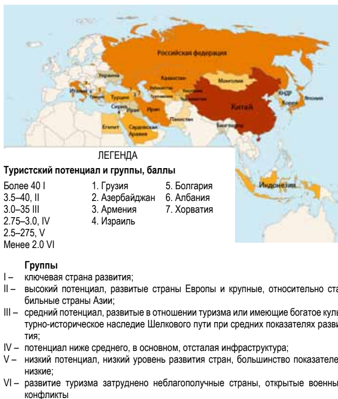
Рис. 3. Туристский потенциал стран Шелкового пути, 2017 г.

ществуют крупные транспортные коридоры, связывающие Восток с Западом, в отличие от других стран Средней Азии.